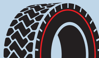
Limite d'usure légale

D'autre part, les pneus fabriqués avec des matériaux moins chers s'usent plus vite et plus irrégulièrement. En conséquence, les chariots peuvent être en dessous de la limite d'usure légale en certains endroits – ce qui est très dangereux.